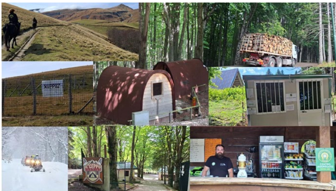
Figura 2: la pluralità delle attività sul territorio dell'Antica Università Agraria di Rocca Santa Maria

in montagna che si adattino alla cultura contemporanea – e la necessità di contingentare quantitativamente tali pratiche per non compromettere l'equilibrio territoriale.